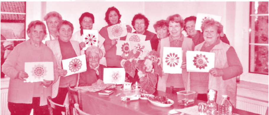
„Das blumige Frauencafé in Stendell“