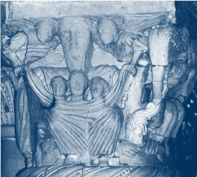
Gefunden im Baseler Münster

mit den Gästen aus unserer Partnergemeinde Lefika in Soweto/Südafrika