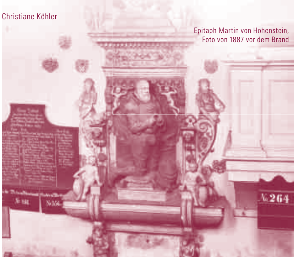
Epitaph Martin von Hohenstein, Foto von 1887 vor dem Brand