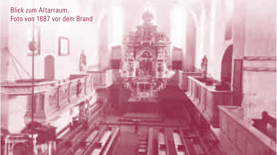
Blick zum Altarraum, Foto von 1887 vor dem Brand